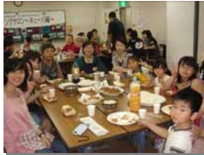
みんなで作ったキューバ料理