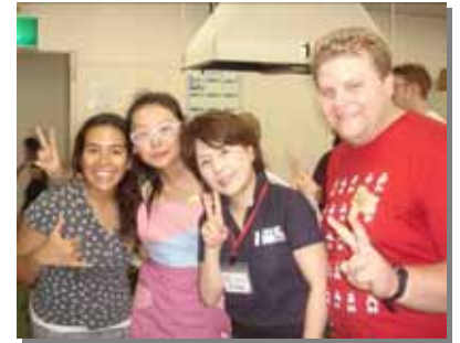
料理を通じた交流ができました