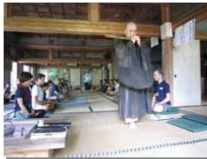
座禅体験での一コマ...緊張...