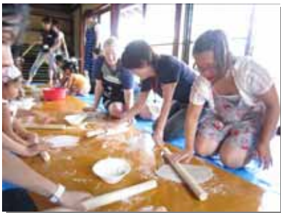
協力しながらそば打ち

9月11日・12日の2日間、市内外に住む在住外国人が1泊2日のホームステイを行う「和風ジャパン」を開催しました。今回はホームステイの前に日本文化体験バスツアーを敢行！参加者全員で吾平上山稜 大隅広域公園でそば打ち体験 志布志 大慈寺で座禅体験とディープな日本文化体験スポットを巡り、外国人はもとより、日本人参加者も日本文化の奥深さを体験しました。特に座禅体験では、静寂の中に警策(ケイサク)で背中を打たれる音が響き渡り、自らを律するきっかけとなっただけでなく、心を落ち着ける良い機会となりました。(ノ´`ノ)