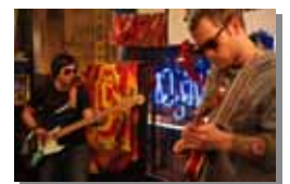
ギターの達人の2人！

皆さ～ん、なんか相当久しぶりな感じがしますね～ 元気にはしていましたか？ 最近、鹿屋でも外国人をよく見かけるようになりましたが、見かける度に多くの人(僕も含めて)は「あーこの人は英語の先生なんだろうなー」って思うのです。しかし、英語の先生だったとしても、多くの在日外国人は様々な才能があり、かなり多様です。例えば大隅半島でも、プロの写真家、アクション小説の作家、3ヶ国語以上喋れるALT、サーフィンの先生、バンドを組んでいる外国人達がいます。これが今度の10月17日の「インタナショナルデー」のきっかけとなりました。せっかくだらうな才能を持っている人たちが近くに沢山いるのに「勿体ないなー」と思いました。なので、是非17日に「インタナショナルデー」に来てみて、いろんなことを楽しみながら、勉強して下さい。私も当日、ポイを教えますので、ポイにまだ触れたことない人でも、私のところに来て下さいね。(ネイサン)