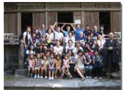
参加者全員でパチリ